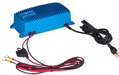
Blue Smart IP67 Ladegerät 12/25