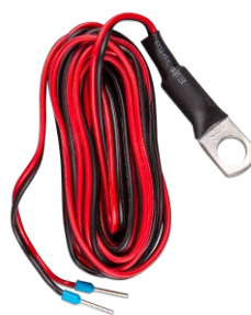
Temperatursensor für Quattro-, MultiPlus- und GX-Geräte (wie den Cerbo GX)

Dieser Adapter ist so konzipiert, dass das CCGX-Display einfach durch den neueren GX Touch 50 oder den GX Touch 70 ersetzt werden kann. Der Inhalt der Verpackung besteht aus der Metallhalterung, der Kunststoffblende und vier Befestigungsschrauben.