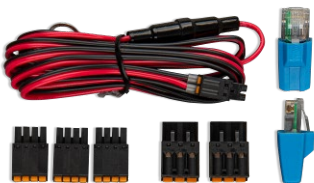
Zubehör im Lieferumfang des Cerbo GX