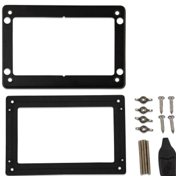
Zubehör im Lieferumfang des GX Touch